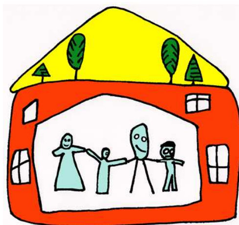
Projekt "Podaná ruka k svépomoci"

Projekt staví na skutečnostech, které byly zjišťovány členy Novohradské občanské společnosti při vstupní analýze potřeb cílových skupin. Současně se opírá např. i o zkušenosti N.O.S. z přípravy projektů pro LEADER.